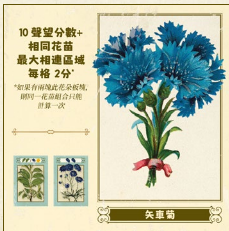
10 聲望分數+相同花苗最大相連區域 每格 2分

在遊戲結束時，花園中包含本花朵板塊的玩家會從本板塊獲得10聲望分數。此外還獲得相同花苗相連最大區域格數x2的聲望分數（相同花苗指播種板塊上顏色和種類都相同的花卉圖案）。