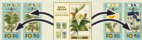
黃色玩家擁有的花朵板塊。

註：綠色的花朵板塊可以覆蓋到2塊綠色植物板塊上，或覆蓋到1塊黃色植物板塊與1塊藍色植物板塊上，只要被覆蓋的兩塊所需板塊彼此長邊相鄰即可。