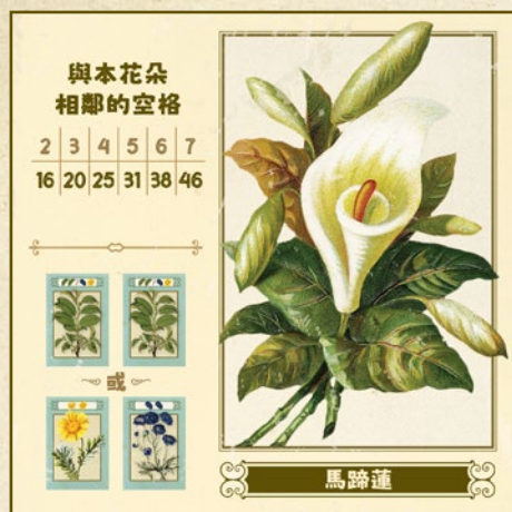
與本花朵相鄰的空格

玩家會按照表格所示，從與本花朵相鄰的空格中獲得聲望分數。一個空格為播種板塊上一格花苗的大小且沒有被任何板塊佔據的空間。在花園中，花朵板塊必定至少與1塊播種板塊上的一格花苗相鄰，所以相鄰的空格數量最多為七格。