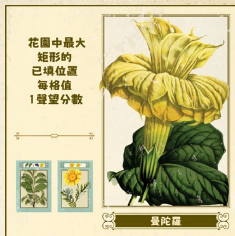
花園中最大矩形的已填位置 每格值 1聲望分數

玩家會按照表格所示，從與本花朵直接相鄰的其他花朵中獲得聲望分數。此處的相鄰可以只有半條邊相接，但是對角相鄰不算在內（在二人遊戲中，玩家有可能使5塊花朵板塊與此板塊相鄰，但是此板塊最多只能獲得表格上所示的45分）。