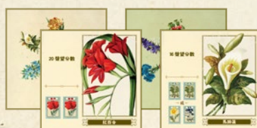
54塊 花朵板塊 (30塊基礎板塊, 24塊進階板塊)