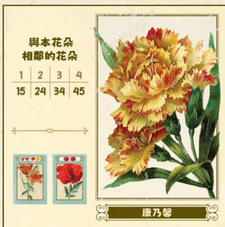
與本花朵相鄰的花朵

玩家會按照表格所示，從與本花朵相鄰的空格中獲得聲望分數。一個空格為播種板塊上一格花苗的大小且沒有被任何板塊佔據的空間。在花園中，花朵板塊必定至少與1塊播種板塊上的一格花苗相鄰，所以相鄰的空格數量最多為七格。