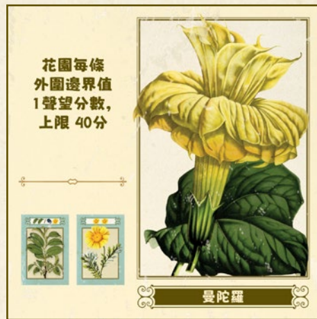
花園每條外圍邊界值 1聲望分數，上限 40分

在遊戲結束時，花園中包含本花朵板塊的玩家會從本板塊獲得10聲望分數。此外還獲得相同花苗相連最大區域格數x2的聲望分數（相同花苗指播種板塊上顏色和種類都相同的花卉圖案）。